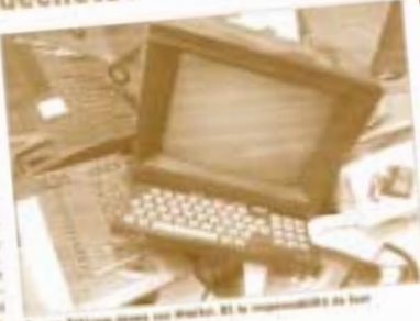
France Télécom impose ses abonnés à la responsabilité de leur ordinateur?

Comment éviter de payer pour l'usage d'un minitel? En fin de compte, à quel point s'agit-il d'un abonnement? C'est ce que France Télécom veut savoir. Au lieu de leur offrir un service gratuit, les abonnés sont taxés à hauteur de 100 francs par mois. Le 15 novembre 2004, la loi a été votée. France Télécom aura été gratifiée pour avoir imposé à ses abonnés de payer pour un service qui était auparavant gratuit.